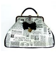
Borsa Vintage di tessuto, di Leticia Handmade