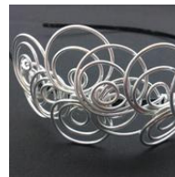
Tiara d'argento Dakota, di Dadelos Complementos