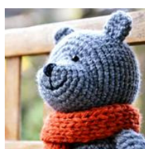
Modello di orsacchiotto