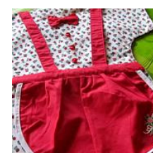
Borse di pinzette