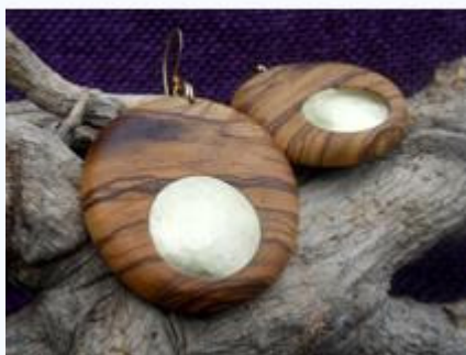
Orecchini a quattro mani

e l'energia negativa, fanno di questa pietra un minerale molto speciale.