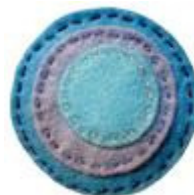
Spilla di feltro di Farbalans