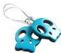
Orecchini di Hawlita di Sandstar Jewelry Designs