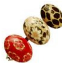
L'angolo di Amatista