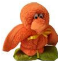
Pulcino de Origamani