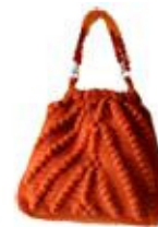
Borsa di Oltrelalana Accessori In Lana