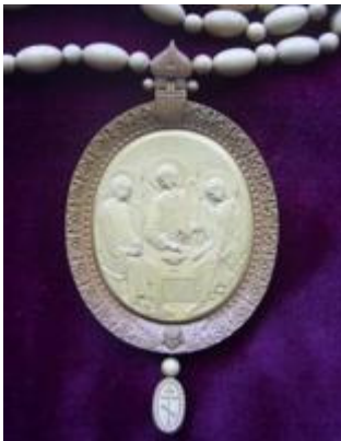
Panagia - Piccola icona Sergei Lagutov