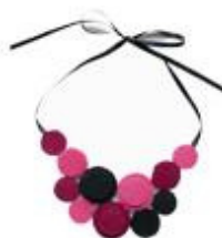
Collana bavaglino di Doce patitas