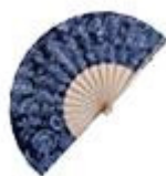
Alabastrina T. Decorativas

I scriviti alla nuova tendenza della moda: riciclare, riutilizzare, dare una seconda opportunità... tutto per contribuire a prendersi cura del medio ambiente. L'ultima novità della moda dei vestiti la crea RFM in Italia. Creatività, sostenibilità e buon gusto concentrati in un disegno e confezione artigianale di vestiti come questa .