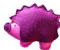
Espinete di Planeta Piruleta