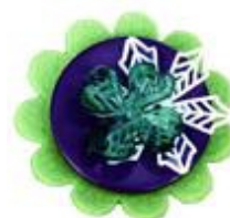
Casual chic di Coração De Pássaro