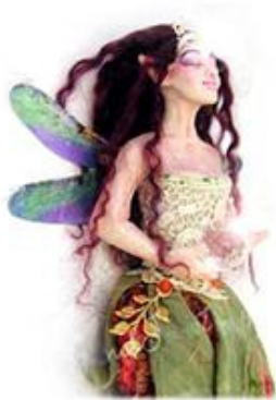
Ciondolo Fata Feng Shui Handfantasy