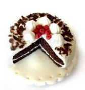
Spilla bosco negro di Tampinha