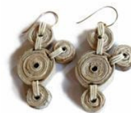
Orecchini di carta di Js Design Sustentavel