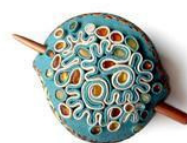
Pinza per i capelli di Cristerio - Критерий