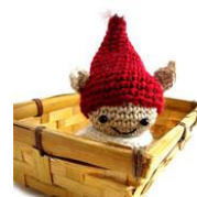
Duendecillo ricamo di Airali Handmade