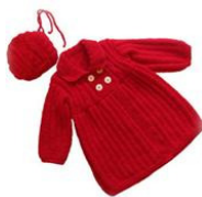
Cappotti di lana di cotone di Abuelita Marisa

Dopo molti studi di tessuti e nuove tecniche, cominciarono a creare vestiti fatti totalmente a mano. Passarono per San Paolo e alla fine aprirono un laboratorio a Barcellona. Musa Bamba presenta la borsa Origami , con un disegno ispirato in quest'arte giapponese, fatto di fuxico e adattabile nella grandezza e nella forma. Un regalo perfetto per una donna moderna! Dovresti mettere in qualche posto che Minas Gerais è una regione, perché si confonde con il nome del negozio.... fino a che appare il nome reale del negozio.