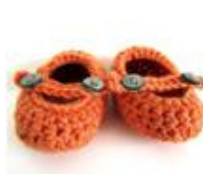
Scarpette di Tramontana