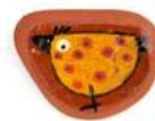
Spilla di Corda Bamba