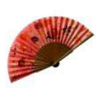
Ventaglio di seta di Pinturasobreseda