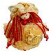
Spilla di Las Muñecas De Mama