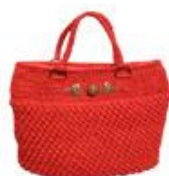
Borsa di Maravillas de Ganchillo