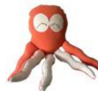
Bambola Polpo di Chicamama