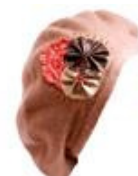
Berretto di lana di La Muka