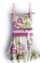
Spilla vestito steso di Jarrillo De Lata