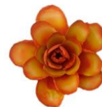
Rosa arancione di Paulooliveiraartesanato