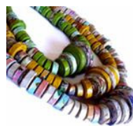
Collana di carta di Js Design Sustentave

Per creare questo tavolo da gioco di scacchi e dama , utilizzò diversi tipi di legno: noce, ciliegio, teca, ontano e pino russo, formano la quadratura solida gli occhi di un esperto, sarà difficile resistere.