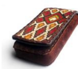
Portacellulare in cuoio di Quiron Cuero